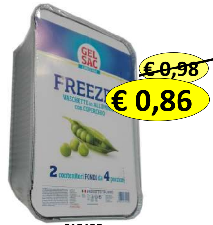
015135 CONT ALLUM+COP GR 63 4 PORZ. ALTO 18X26X6H CM X 2 PZ