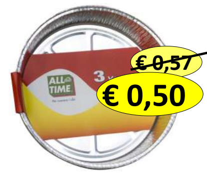
015170 CONT ALLUM.S.COP. TORTE 3 VASCHETTE D229X40MM