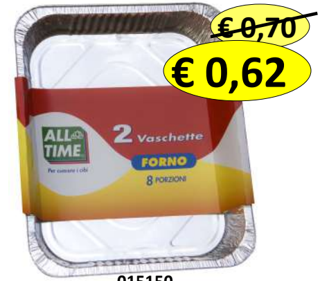
015150 CONT ALLUM. S. COP. 8 PORZ. 2 VASCHETTE 321X261X41