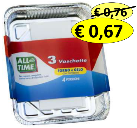
015130 CONT ALLUM+COP 4 PORZ 3 VASC. 225X175X33MM