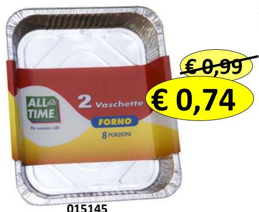
015145 CONT ALLUM+COP 8 PORZ 2 VASCH. MM 325X260X51