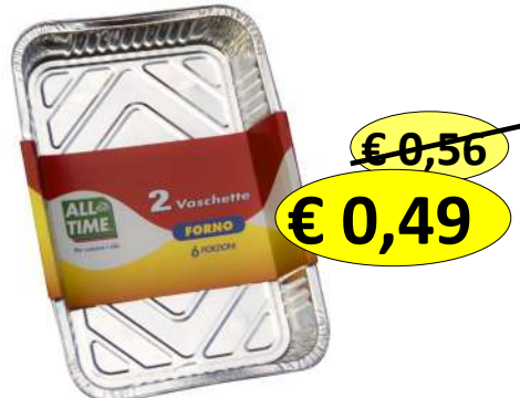
015165 CONT ALLUM S/COP 6 PORZ 2 VASC. MM 315X214X44