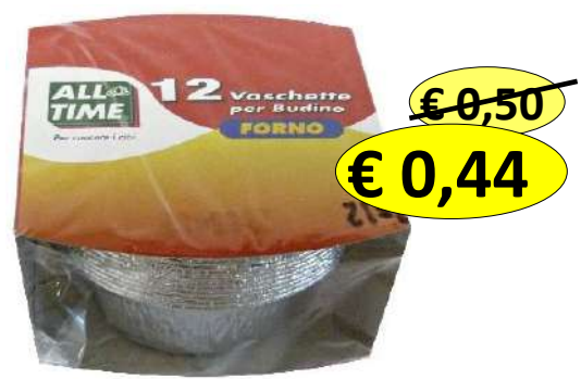
015160 CONT ALLUM.S.COP. BUDINO 12 VASCHETTE D85X39MM