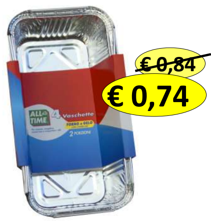
015105 CONT ALLUM+COP 2 PORZ 4 V PLUM 218X113X54MM