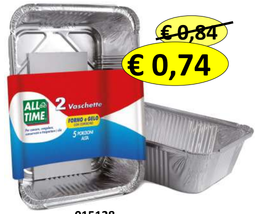
015138 CONT ALLUM+COP 5 PORZ ALTO MM 260X190X65