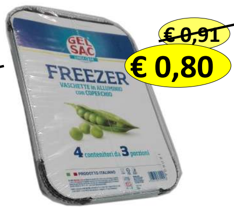
015147 ALL TIME CONT ALLUM+COP GR 8 3 PORZ 14X19X4H CM X 4 PZ