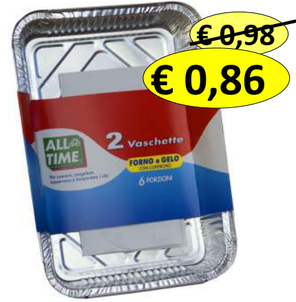
015140 CONT ALLUM+COP 6 PORZ 2 VASCHETTE 315X215X43MM