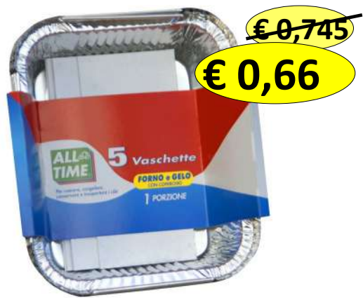
015110 CONT ALLUM+COP 1 PORZ 5 VASCHET- TE MM 147X123XH40